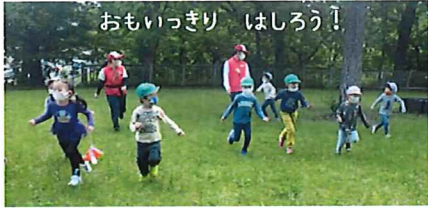
おもいっきり はしろう！

ひろいはらっぱで、からだをうごかしてあそびます。 おともだちもたくさんつくることができます。