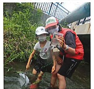
この生き物 なんだろね〜