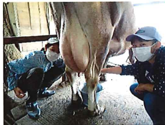
夕方と朝の2回、手しぼりの搾乳体験ができる!

うし そだ ぎゅうにゅう しゅうか たくのうか しごと 牛を育て、牛乳をしぼり出荷している酪農家のお仕事を体験します。牛乳について学び、牛の一生について知り、あたり前に食べている食べ物についても考えるキャンプです。秋にも酪農体験キャンプ②を実施します。