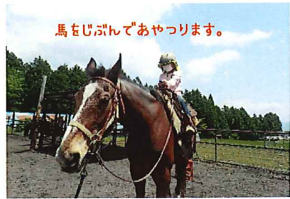
馬をじぶんであやつります。