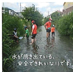
水が湧き出ている、安全できれいな川です